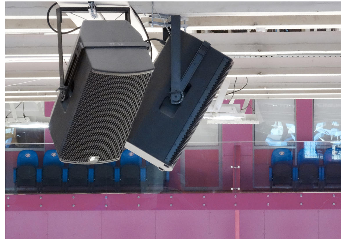
Die PT-70 von Fohhn: Horngeladen. Kardiod. Plug & Play.