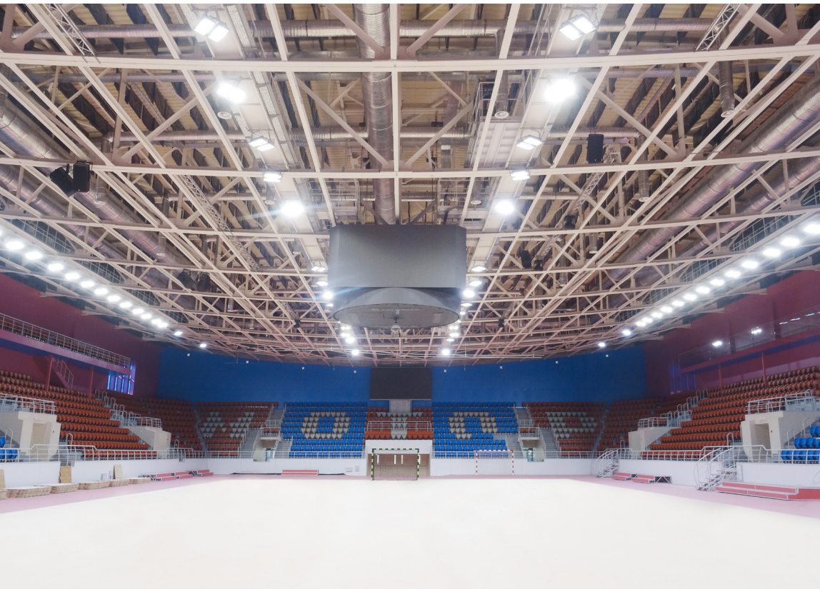
Nach dem Umbau: die neue Heimstätte des HK Motor Saporischschja.

Motor Sich Sportkomplex, Saporischschja, Ukraine