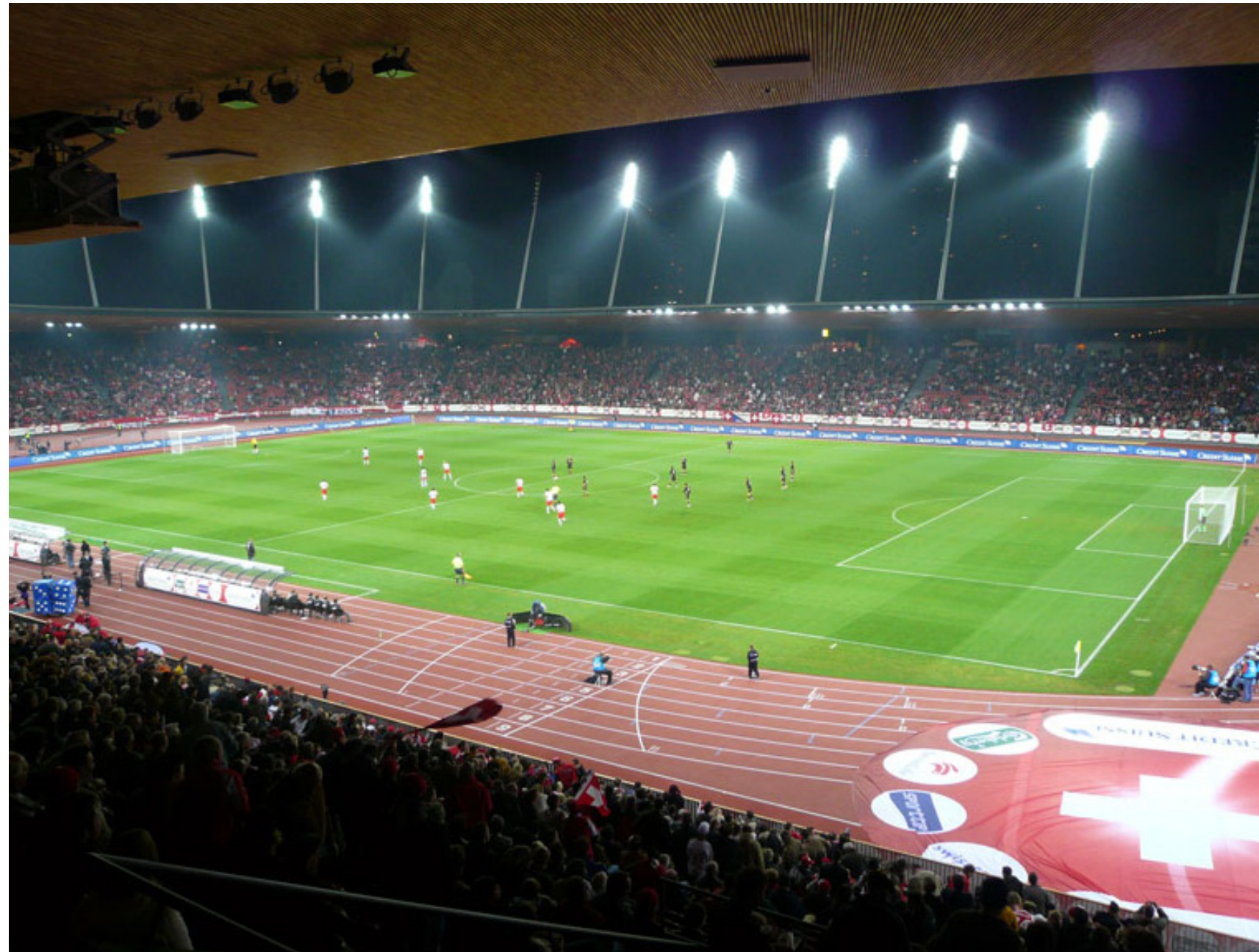
EM-tauglich: die Heimstätte der Fußballvereine FC Zürich und Grasshoppers Zürich.

mehrere passive Lautsprechersysteme der Arc-Series