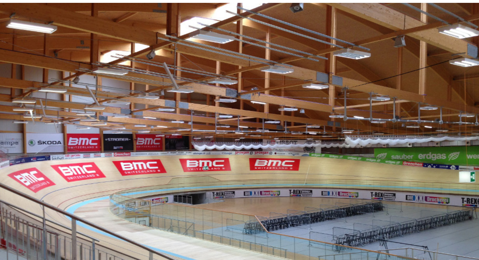
Flexible Wahl der Beschallungszonen: mittels FR-10 Fernsteuerungsmodul.

Hohe Sprachverständlichkeit: Linea Focus Systeme mit Fohhn Beam Steering Technology.