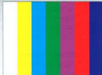
100% lebensechte Farben