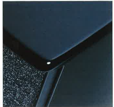
Hochwertiger Klavierlack veredelt die Gehäuse.

Bei der Serie handelt es sich um 2-Wege Bassreflexsysteme, die sich in