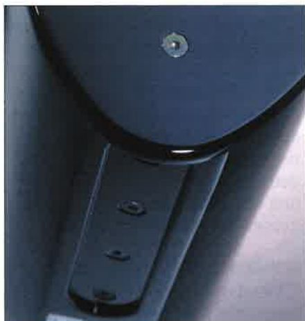
Die Boxen werden über Speakon oder innenliegenden 4-fach Klemmen angeschlossen.

Zugegeben, wenn sich der gemeine Konferenzraumbesucher ein Lautsprechersystem vorstellt, dann sieht er es entweder nicht, da es fest in Decke oder Wänden installiert ist oder es besteht aus sperrigen Kunststoff-Gehäusen die irgendwie auf Dreibeinen montiert sind. Dass es auch anders geht zeigt der Nürtinger Lautsprecherhersteller Fohhn Audio mit der neuen ARC-Serie, die den Zusatz Boardroom bekam. Offensichtlich wird auf den Vorstandsetagen das Verlangen nach edlen Lautsprechern größer, mit denen nach schwierigen Sitzungen zu Musik- oder Filmdarbietungen geladen wird – natürlich im 5.1-Mehrkanal-Sound. Aber auch nor-