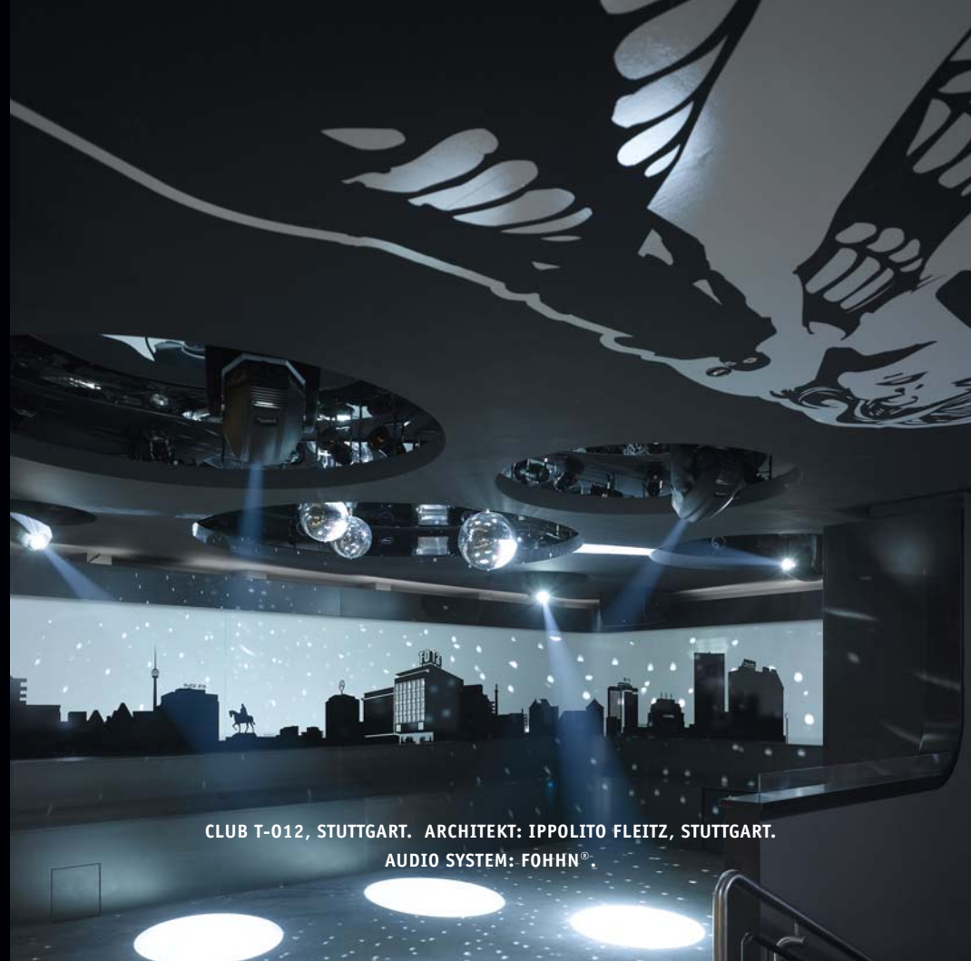
CLUB T-012, STUTTGART. ARCHITEKT: IPPOLITO FLEITZ, STUTTGART. AUDIO SYSTEM: FOHNN®.

FÜR DEN PERFEKTEN ABEND IN DEN ANGESAGTESTEN CLUBS DER STADT BRAUCHT ES DEN PERFEKTEN SOUND. GUT, DASS ER DA IST.