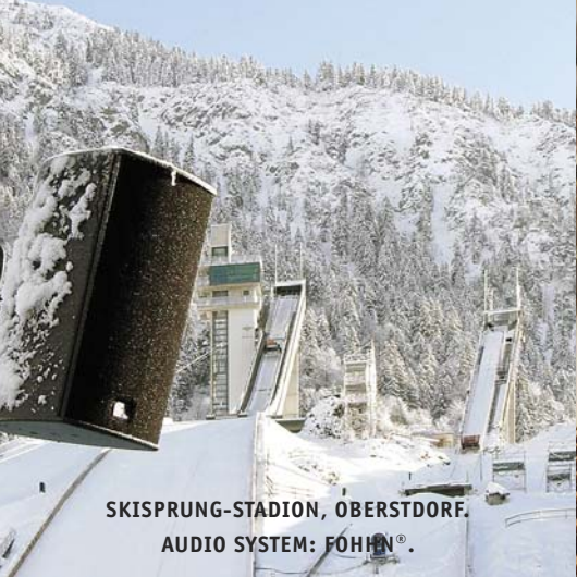
SKISPRUNG-STADION, OBERSTDORF. AUDIO SYSTEM: FOHNN®.