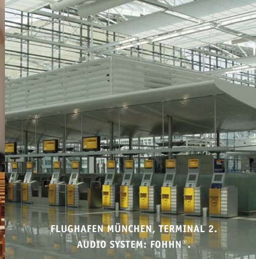
FLUGHAFEN MÜNCHEN, TERMINAL 2. AUDIO SYSTEM: FOHNN®.