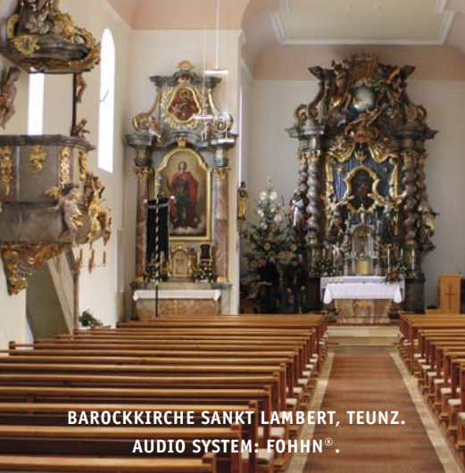
BAROCKKIRCHE SANKT LAMBERT, TEUNZ. AUDIO SYSTEM: FOHNN®.