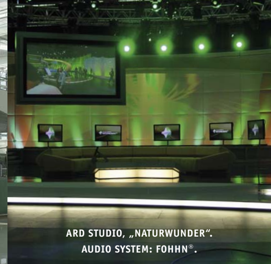
ARD STUDIO, „NATURWUNDER“. AUDIO SYSTEM: FOHNN®.

Audio Systeme von Fohhn® bringen Höchstleistung bei Minusgraden in den Alpen oder in klanglich anspruchsvollsten Sakralbauten. Und an zahlreichen anderen Orten: in Clubs, Theatern, Stadien, Flughäfen, Shops, Konferenzräumen und und und. Von Las Vegas bis Moskau. Von Helsinki bis Peking.