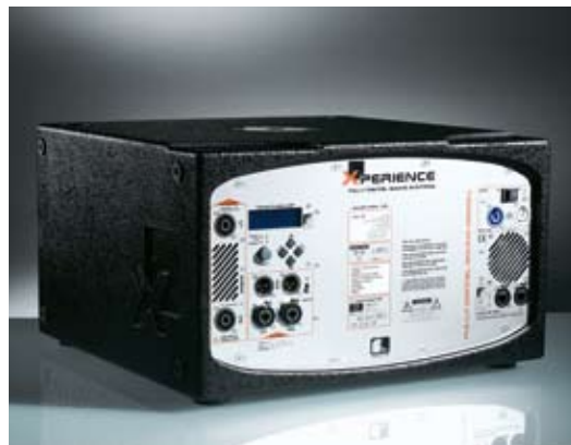
Der ultrakompakte Aktiv-Subwoofer XS-10 (Vorder- und Rückansicht)