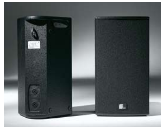
Das 8"/1"-CD-Top XT-10

An den Aktiv-Subwoofer XS-10 können 2 bis 4 Topteile und ein zusätzlicher passiver Sub (XSP-10) angeschlossen werden.