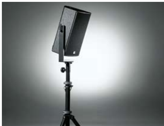
Optimale Ausrichtung der XT-10 auf das Publikum.