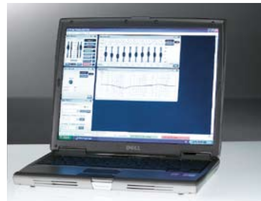
Fernbedienung per Laptop.