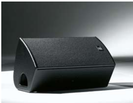
XT-10 – Ideal einsetzbar als Monitor.

Der Anwender hat zudem wie bei den grösseren Xperience-Systemen die Auswahlmöglichkeit für prinzipiell alle Topteile aus dem Fohhn-Programm. Für Heimanwendungen sind die Topteile der ARC Serie AT-05, AT-06, AT-07 oder Linea AL-20, AL 50 bestens geeignet. Diese sind in allen RAL-Farben, sowie in edlem Klavierlack erhältlich. Für jedes Topteil ist ein optimal angepasstes Preset in der integrierten Lautsprecherdatenbank hinterlegt.