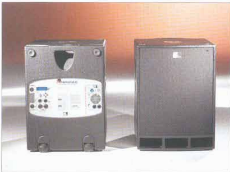
Die Endstufen des XS-30 active leisten 1.500 Watt RMS für den Subwoofer und zweimal 750 Watt RMS für die beiden Säulen.

an der Rückseite der Box beherbergt zwei Speakon-Anschlüsse der Marke Neutrik.