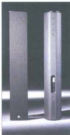
Das Gehäuse ist aus hochwertigem Multiplex-Birkenholz gefertigt und mit schwarzem Polyurethan-Lack beschichtet. Das Anschlussfeld an der Rückseite ist versenkt angebracht.

Die LX-501 verfügt über zwei integrierte Griffmulden an der Stirnseite sowie einen anschraubbaren Griff an der Rückseite. Das Gehäuse wird aus hochwertigem Multiplex-Birkenholz gefertigt und ist serienmäßig mit schwarzem Polyurethan-Lack beschichtet. Auf Wunsch kann es in allen RAL-Farben lackiert werden. Auch die Grundversion sieht schon edel und ansprechend aus und fügt sich unauffällig in den Raum ein – ein unschlagbarer Vorteil, wenn die Beschallung mal wieder hinter den optischen Ansprüchen einer Veranstaltung zurückstehen muss. Die handwerkliche Qualität des Teils ist über jeden Zweifel erhaben. Der Vollständigkeit halber: Die Front schützt ein solides Gitter nebst Akustikschaum, das versenkte Anschlussfeld