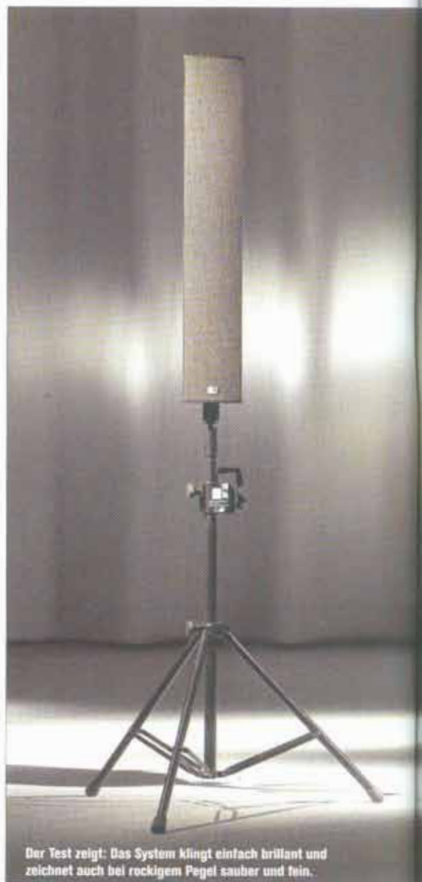
Der Test zeigt: Das System klingt einfach brillant und zeichnet auch bei rockigem Pegel sauber und fein.

Modul Nummer eins übernimmt die optimale Abstimmung aller Systemparameter und sorgt mit einem speziellen Multiband-Limiting für optimalen Schutz aller Lautsprecherkomponenten. Modul Nummer zwei stellt dem Anwender umfangreiche Bearbeitungsmöglichkeiten zur Verfügung. Unter