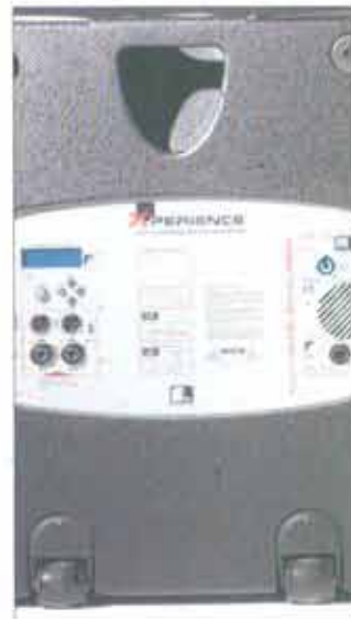
Die beiden eingebauten Rollen erleichtern den Transport des Subwoofers.

Mit dem Testsystem lassen sich durchaus mittelgroße Veranstaltungen auf hohem klanglichen Niveau versorgen. Durch die sehr akkurate Abstrahlung sind auch akustisch schwierige Räume in der Regel einfacher zu versorgen. Mit dem sehr breiten, horizontalen Abstrahlungsbereich von 100 Grad bleiben auch die ersten Reihen Zuschauer oder Gäste nicht im Dunkeln sitzen. Für größere Veranstaltungen kann auch ein zweiter Subwoofer dazugestellt werden; beim Pegel halten die beiden Säulen hier sicherlich Stand. Uli Hoppert